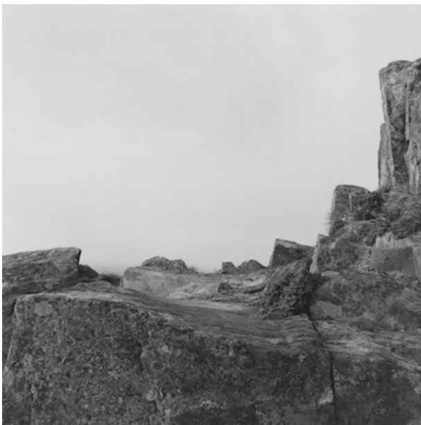
© Chrystèle LERISSE, Sans titre , 1985, 25 x 25 cm in Chrystèle LERISSE, Enter into Photography de Sam Basu, Artzo éd. 2021