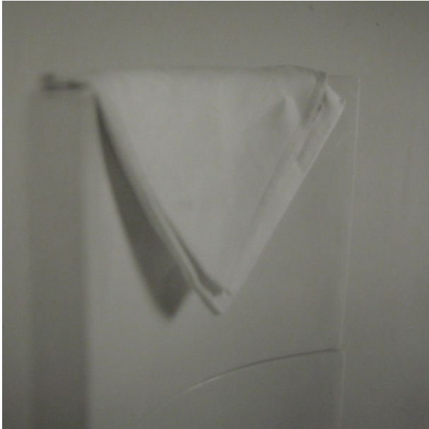
© Chrystèle LERISSE, Le blues de la serviette, I , 2017, 6 x 6 cm in Solitudes des tables , Editions ZA, 2022